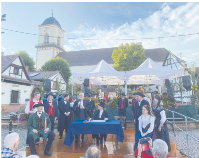
Szene aus der nachgespielten Hochzeitsgeschichte

Namensgeber des Festes ist der französische Roman „L'Ami Fritz“ aus dem 19. Jahrhundert, dessen Handlung in der Hochzeit der beiden Hauptpersonen Fritz und Suzel gipfelt. Diese Geschichte wird im Rahmen des Marlenheimer Festes jährlich nachgespielt. Dies ließen sich auch in diesem Jahr insgesamt 40 Rusterinnen und Ruster nicht entgehen.