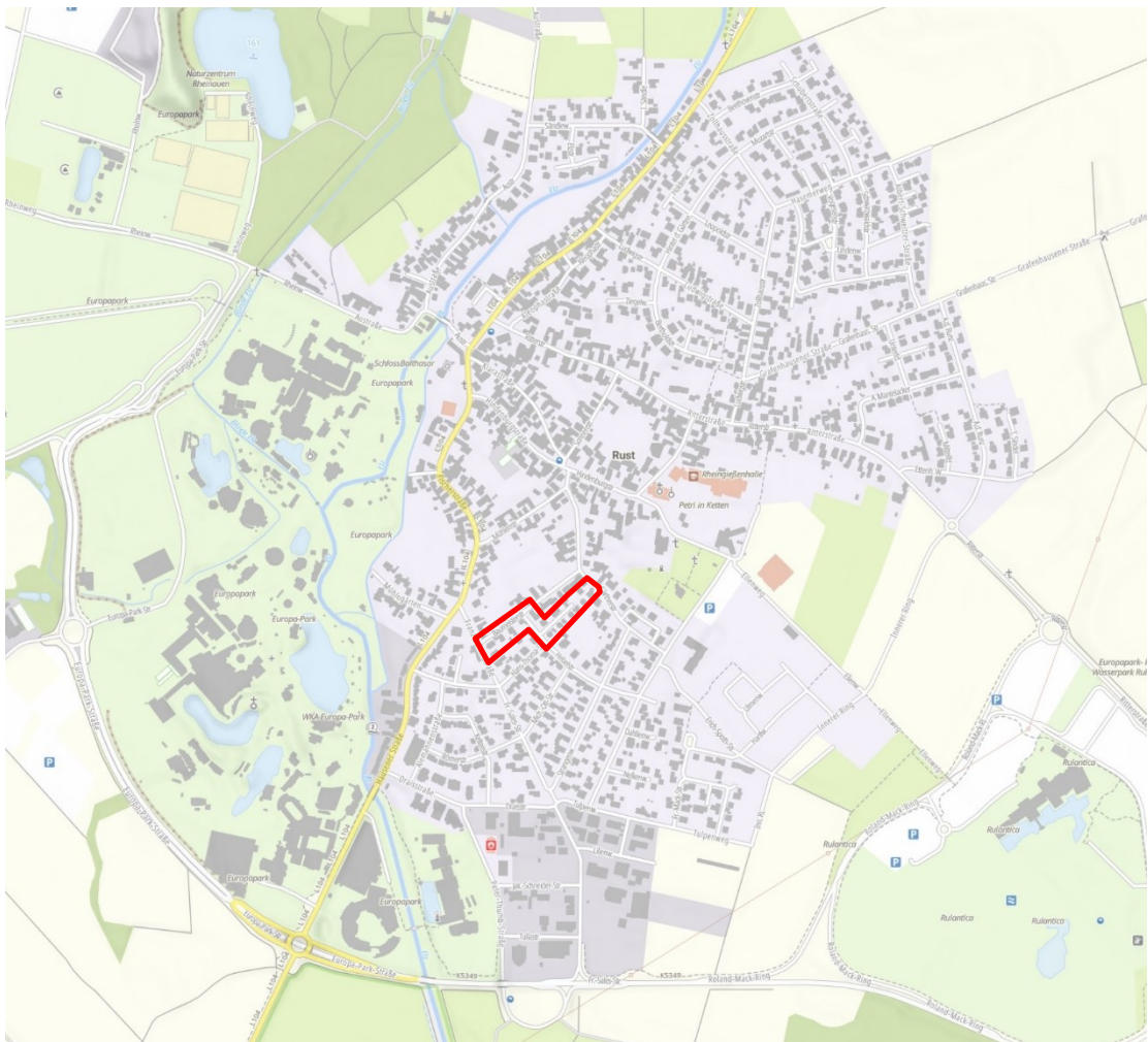
Lage des Plangebiets im Ort, Umgrenzung Plangebiet mit roter Linie

Beim Plangebiet handelt es sich um bereits komplett baulich genutzten Innenbereich. Für den Gesamtbereich des Plangebiets galt bisher der qualifizierte Bebauungsplan „Kühläger und Oberfeld II“, der 1994 in Kraft getreten ist. Der Geltungsbereich der nun vorliegenden ersten Bebauungsplanänderung ist deckungsgleich mit dem Geltungsbereich des ursprünglichen Bebauungsplans.